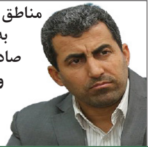
رئیس کمیسیون اقتصادی مجلس:

مناطق آزاد در ایران به جای سکوی صادرات به دپوی واردات تبدیل شده‌اند